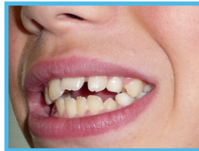
Een afwijkende gebitsstand (door duimzuigen; linkerduim).

Een andere afwijkende mondgewoonte is het duim-/vinger-/speenzuigen. Het zuigen op een duim, vinger(s) of speen is normaal bij een baby en peuter, omdat zij nog een grote zuigbehoefte hebben. Het geeft veiligheid. Wanneer een kind dit op driejarige leeftijd nog steeds doet, is er sprake van afwijkend monddrag. Door deze gewoonte kunnen de tanden scheef groeien. Ook kan de vorm van de mond (het gehemelte) veranderen. Tevens hebben kinderen een grotere kans op een slappe mondmotoriek, waardoor afwijkend slikken kan optreden. Duim-/vinger-/speenzuigen moet daarom zo snel mogelijk worden afgeleerd.