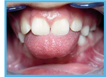
Een afwijkende slikgewoonte (protrale tongpers).

Ook tijdens het spreken kan de tong tussen de tanden komen. Slissen is het gevolg; het spreken wordt er vaak onduidelijk van.